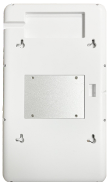
壁挂式金属安装底板预装墙面示意图